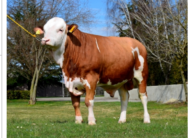
CTM CHIEVOLAN ★ ★ ★

Fenotipo Indice Attitudine carne: 96 Incr. medio gg: 1375 Taglia perf. test: 85 Muscol. perf.: 84 Arti perf. test: 82 114