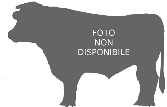
FOTO NON DISPONIBILE

Indice Fenotipo Indice carne PT: 99 Muscol. PT: 94 Incr. medio gg PT: 102 R.F.I. PT: 106 Peso 12 mesi PT: 90 Qualità vitelli: Beef line: IMG carcassa: