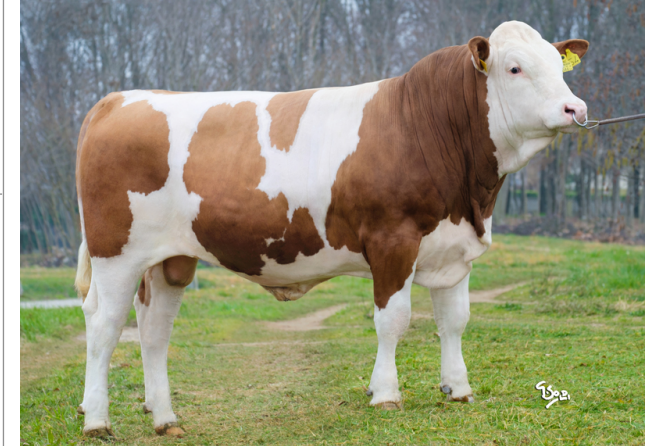
CTM MODESTE Pp

Indice carne PT: 108 Muscol. PT: 96 82 Incr. medio gg PT: 102 R.F.I. PT: 131 Peso 12 mesi PT: 105 Qualità vitelli: 107 Beef line: 118 IMG carcassa: 95