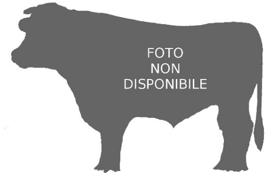
FOTO NON DISPONIBILE

Indice Fenotipo Attitudine carne: 101 Taglia perf. test: 92 Muscol. perf.: 101 Arti perf. test: 100 Incr. medio gg: 117 RFI: 103 Peso 12 mesi: 102