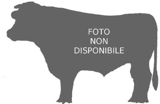
ZAMUR - 2000

Indice Fenotipo Indice carne PT: 94 Muscol. PT: 92 86 Incr. medio gg PT: 85 1502 R.F.I. PT: 102 Peso 12 mesi PT: 98 Qualità vitelli: 98 Beef line: 100