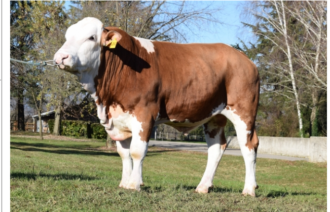
CTM WANCO Pp*

Indice Fenotipo Attitudine carne: 110 Incr. medio gg: 98 1615 Taglia perf. test: 118 86 Muscol. perf.: 121 86 Arti perf. test: 108 80