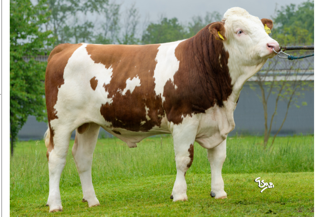
CTM EDELWEISS ★ ★ ★

Indice Fenotipo Attitudine carne: 104 Taglia perf. test: 115 82 Muscol. perf.: 101 82 Arti perf. test: 121 84 Incr. medio gg: 107 1513 RFI: 109 Peso 12 mesi: 103