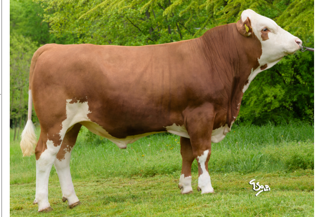
CCT HERMAGOR ★★★★

Indice Fenotipo Indice carne PT: 111 Muscol. PT: 105 84 Incr. medio gg PT: 97 1608 R.F.I. PT: 126 Peso 12 mesi PT: 106 Qualità vitelli: 91 Beef line: 117