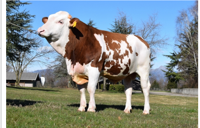
CTM WELLO ★

K-Caseine: AA Beta-Caseine: A1A2 Beta-Lattoglobuline: Non disponibile Aracnomelia: Libero BMS (infertilità masch.): Libero DW (Nanismo): Libero FSH2(Accresc. ritard.): Libero TP (Trombopatia): Libero ZDL (Zincodeficienza): Libero BH2(Aplotipo 2 Bruna): Libero FH4 (Aplotipo 4 della P.R.): Libero FH5 (Aplotipo 5 della P.R.): Libero