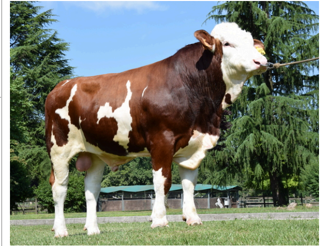
CTM FONZIE ★★★★

Indice Fenotipo Attitudine carne: 111 Incr. medio gg: 113 1712 Taglia perf. test: 107 85 Muscol. perf.: 109 81 Arti perf. test: 115 81