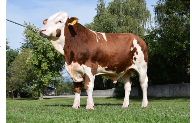
CTM IMPAVIDO ★★★

Indice Fenotipo Attitudine carne: 95 Incr. medio gg: 88 1469 Taglia perf. test: 109 85 Muscol. perf.: 96 83 Arti perf. test: 107 78