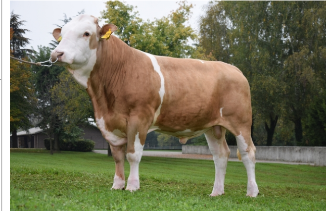
CTM HUMMELS ★ ★ ★

Indice Fenotipo Attitudine carne: 111 Incr. medio gg: 103 1195 Taglia perf. test: 112 85 Muscol. perf. test: 121 82 Arti perf. test: 107 77