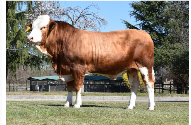
CTM EDONISTA ★★★★

Indice Fenotipo Attitudine carne: 97 Incr. medio gg: 103 1581 Taglia perf. test: 87 79 Muscol. perf.: 90 78 Arti perf. test: 113 79