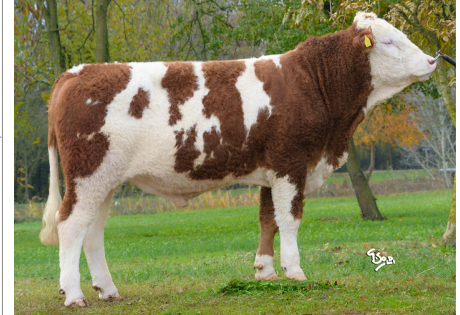
ITZ HOPPER Pp

Indice Fenotipo Indice carne PT: 91 Muscol. PT: 96 79 Incr. medio gg PT: 82 1310 R.F.I. PT: 122 Peso 12 mesi PT: 90 Qualità vitelli: 116 Beef line: 111