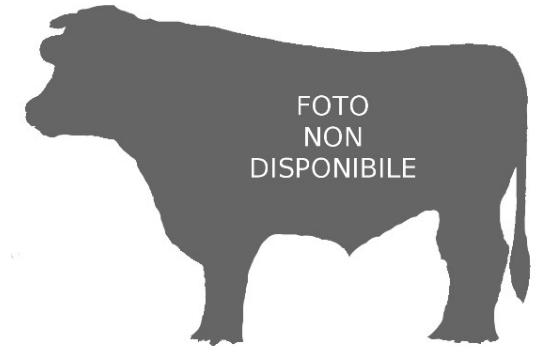
FOTO NON DISPONIBILE

Indice Fenotipo Attitudine carne: 113 Taglia perf. test: 136 89 Muscol. perf.: 120 86 Arti perf. test: 112 83 Incr. medio gg: 66 1644 RFI: 105 Peso 12 mesi: 113