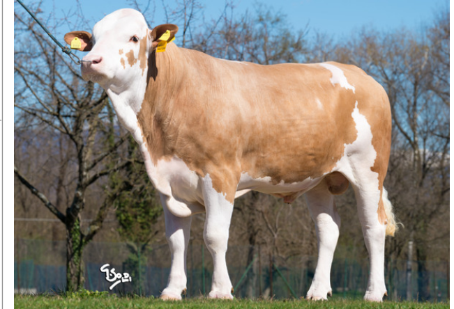
CTM WILLINGTON ★★★★

Indice Fenotipo Attitudine carne: 100 Incr. medio gg: 94 1613 Taglia perf. test: 104 87 Muscol. perf.: 104 83 Arti perf. test: 106 84