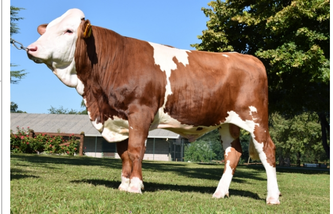
CTM HERMADA ★★★

Indice Fenotipo Attitudine carne: 97 Incr. medio gg: 98 1658 Taglia perf. test: 111 86 Muscol. perf.: 94 78 Arti perf. test: 92 79