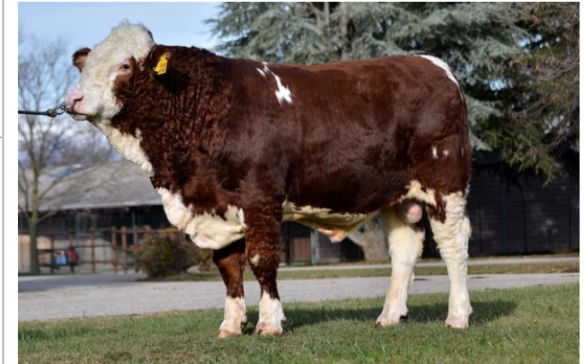
CTM IMPERATORE ★★★★

Indice Fenotipo Attitudine carne: 110 Incr. medio gg: 99 1647 Taglia perf. test: 109 83 Muscol. perf.: 119 84 Arti perf. test: 121 82